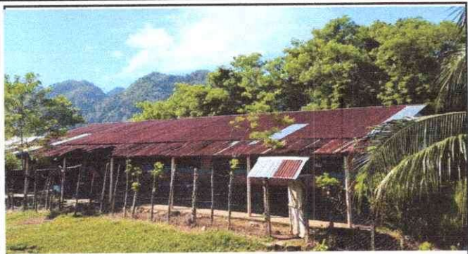
Foto1: Cambio completo de techo por deterioro y goteras